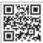
創価大学 法科大学院合 否照会システム QRコード